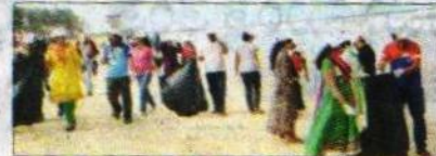
ತಣ್ಣೀರು ಬಾವಿ ಬೀಚ್‌ನಲ್ಲಿ ಕೆನಾರ್ ಸ್ವಚ್ಛಗೊಳಿಸಲಾಯಿತು.

ಪರಿಸರ ಮತ್ತು ಪರಿಸರ ವಿಜ್ಞಾನ, ಮೀನುಗಾರಿಕೆ ಇಲಾಖೆಯ ನಾನಾ ವಿಭಾಗಗಳು ಮತ್ತು ಮೀನುಗಾರಿಕೆ ಕಾಲೇಜು ವಿದ್ಯಾರ್ಥಿಗಳು, ಸಹ್ಯಾದ್ರಿ ಎಂಜಿನಿಯರಿಂಗ್ ಕಾಲೇಜು, ಎಐಇಎಂ ವಿದ್ಯಾ ದೀನಿಣಿ ಪ್ರೌಢಶಾಲೆ, ಸುರತ್ಕಲ್, ಕೂಳೂರು ಪ್ರೌಢಶಾಲಾ