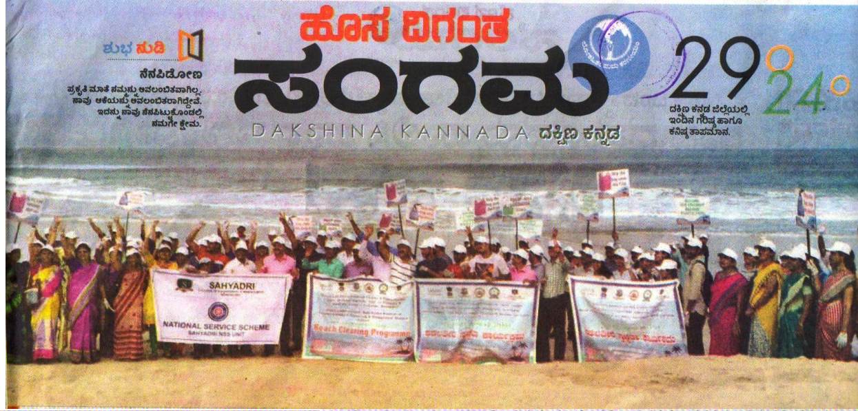
ಪೆಣಂಬೂರು ಬೀಚಿನಲ್ಲಿ ಕಾಲೇಜು ಆಫ್ ಫಿಶರೀಸ್ ಮಂಗಳೂರು, ಜಿಲ್ಲಾ ಆಡಳಿತ, ದಕ್ಷಿಣ ಕನ್ನಡ ಮತ್ತು ಸಹ್ಯಾದ್ರಿ ಕಾಲೇಜ್ ಆಫ್ ಇಂಜಿನಿಯರಿಂಗ್ ಮತ್ತು ಮ್ಯಾನೇಜ್‌ಮೆಂಟ್ ಸಹಯೋಗದಲ್ಲಿ ಬೀಚ್ ಶುಚಿಗೊಳಿಸುವ ಕಾರ್ಯಕ್ರಮ ಪ್ರಾರಂಭಿಸಲಾಯಿತು.