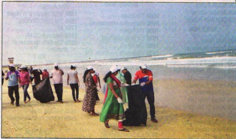
GOOD SAMARITANS: Departments of environment and ecology, department of fisheries officials and students of college of fisheries and Sahayadri Engineering college as well as NGOs and the public, clean Panambur beach in Mangaluru under the tagline "Beat Plastic Pollution", on Saturday

One of the biggest hazards on beaches is plastic. To tackle it, the district admini-