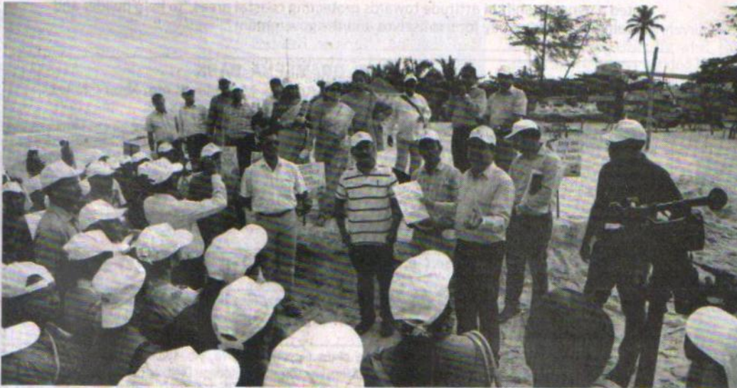
Volunteers cleaning Panambur beach in Mangaluru on Friday